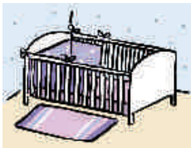
Figure 11.1. Le lit à barreaux répond aux critères « HSC ».

Nous donnons, à titre d'information, quelques notions d'aménagement des espaces de vie en milieu collectif (type crèche).