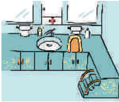
Figure 11.4. La salle de change (section des bébés) avec son équipement.

Zoé réfléchit à l'organisation semblable qu'elle pourra concocter à domicile dans cet esprit-là!