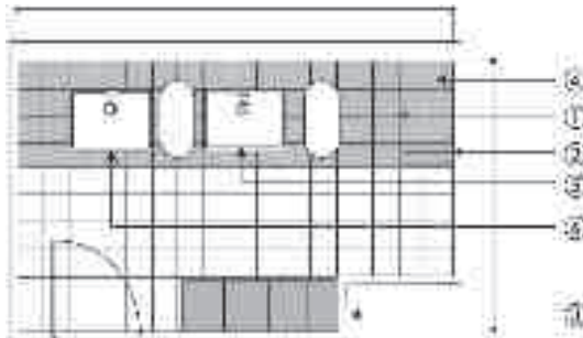
Figure 11.5. Le plan de l'espace sanitaire à la crèche.

Ex : le papier toilette, l'armoire à pharmacie, le placard pour les couches, le linge de toilette, les crèmes, etc, le plan de travail avec les coussins de change, le mini-escalier pour l'enfant.